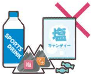
運動会やスポーツ大会への飲食物の差し入れ