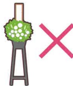
葬式の花輪・供花