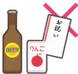
町会の集会や旅行等の催し物への寄附や飲食物の差し入れ