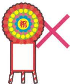
落成式・開店祝いの花輪