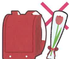
入学祝い・卒業祝い