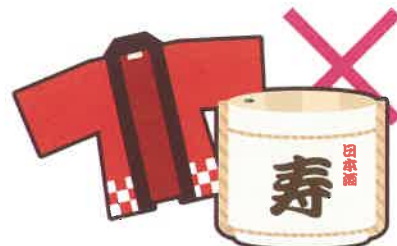
お祭りへの寄附や差し入れ