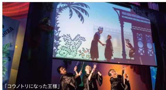
「コウノトリになった王様」

4-3-2) 全席自由/大人2,000円、子ども1,500円(3歳~18歳) 当日500円増。未就学児入場可 メールまたはFAXに氏名、住所、電話番号、チケット枚数、子育て応援券使用の有無を書いて(特)子ども文化NPO M・A・Tまで。折り返し「参加券引換はがき」を郵送。 (特)子ども文化NPO M・A・T ☎FAX3397-5152