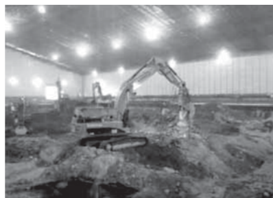
▲テント内での解体・堀削状況

杉並清掃工場の建替工事の情報は、東京二十三区清掃一部事務組合のホームページ等でお知らせしていますのでご覧ください。