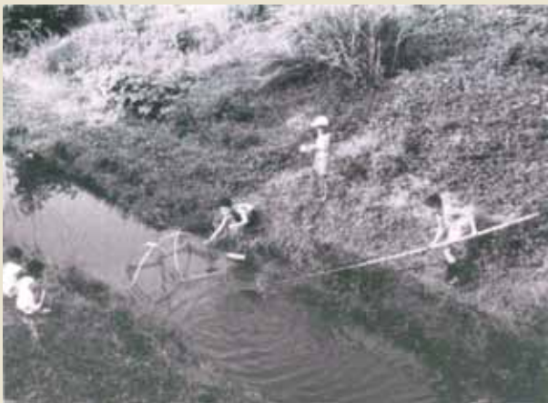
1面、4面の白黒写真：杉並区立郷土博物館発行『レンズの記憶』図録より転載

参考文献：『杉並の古道』『杉並区史跡散歩地図』杉並区教育委員会発行・「柿之木山物語」（『杉並郷土史会会報』119号）井口昭英著・『杉並の川と橋 杉並区立郷土博物館研究紀要別冊』杉並区立郷土博物館発行