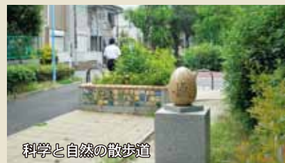
科学と自然の散歩道