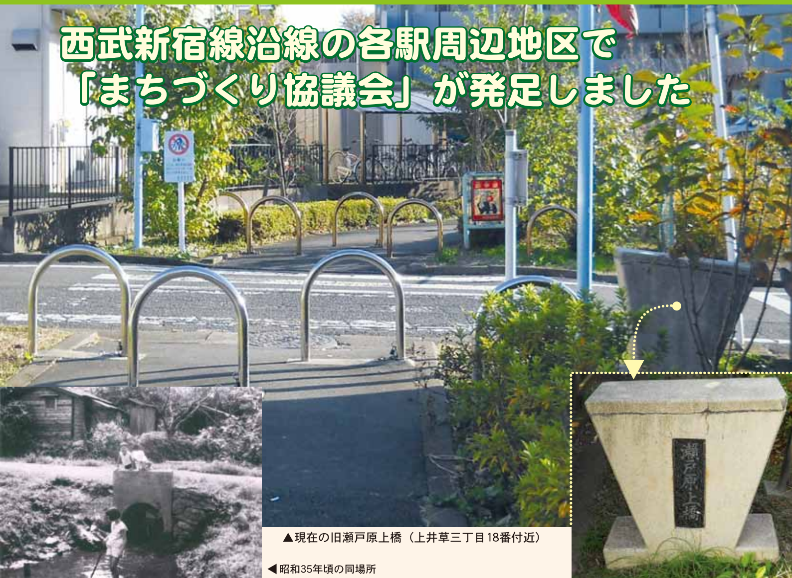
▲現在の旧瀬戸原上橋（上井草三丁目18番付近）