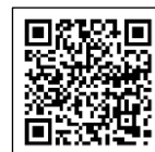
景観計画 重点区域図