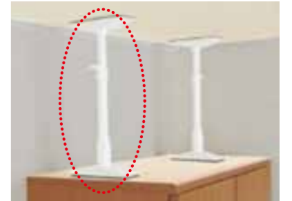
突っ張り棒 家具を固定し、転倒しにくくします。

地震災害に備えるため、区が委託している事業者が「家具転倒防止器具」を無料で取り付けます。地域のたすけあいネットワーク(地域の手)制度にご登録されている方は、特例給付をご利用できます。