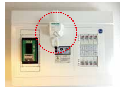
感震ブレーカー 地震を感知すると、自動的にブレーカーを落とす補助器具です。

地震災害時の電気火災を防止するため、震度5強以上の地震を感知すると自動的にブレーカーを落として電気を止める簡易型感震ブレーカーの設置助成を行っています。