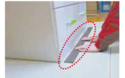
転倒防止板 家具の下に敷くことで、すべりにくくし、転倒を防止します。