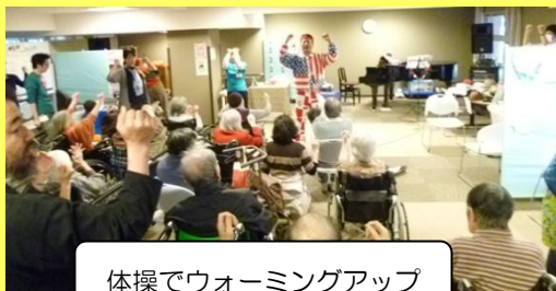
体操でウォーミングアップ