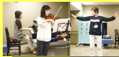
演奏と手話ソングのコラボ