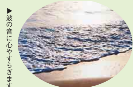
▲波の音に心やすらぎます

※5歳以上は大人と同料金。 ※5歳未満は無料(ただし、寝具・食事は別料金)。 ※12歳以上には、1泊に付き入湯税 130 円が別途かかります。