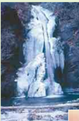
▲雄大な吾妻の自然。写真は上が観音不動滝、右が白根山の紅葉(10月中旬から見ごろ)

群馬県吾妻郡東吾妻町大字原町字岩櫃山 4399 ☎ 0279-68-5338 (午前 9 時～午後 8 時、年中無休) FAX 0279-68-5417 🌐 http://www.iwabitsu.co.jp/