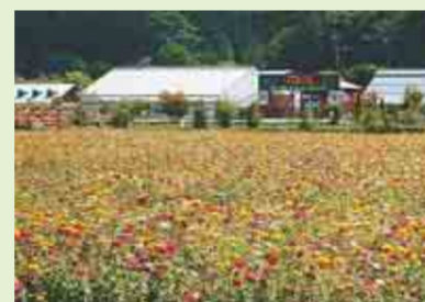
▲四季折々の花が咲き誇る花の都公園