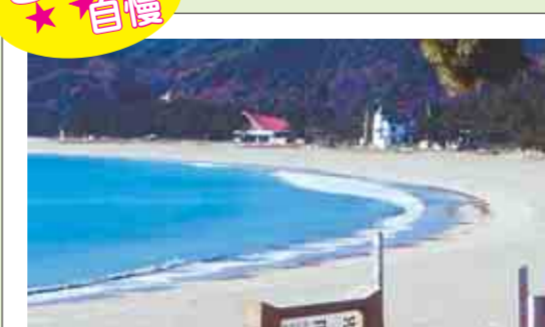
景勝地「弓ヶ浜」。日本白砂青松百選や渚百選で選ばれた、白い砂と浜に沿った松林、青い海の調和が自慢の海岸です。波が穏やかで家族連れに人気があります。