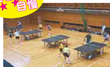
▲体育館の他にもバレーボールコートなどがあります

スポーツ施設が充実している富士学園は、サークルや部活の合宿などにもおすすめです。 特集号を持参した方には、10月26日～20年3月16日の金・土・日曜日限定で、体育館の夜間(午後7時～9時)利用料金を無料サービスします(詳細は、施設へお問い合わせください)。