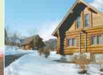
▲パットと泊まれるログハウス

コニファーいわびつは、関東の耶馬溪と呼ばれる吾妻渓谷や、本白根山などの大自然を間近に、四季を直接感じることができる施設です。施設周辺の山々も 10 月下旬から、紅葉の見ごろを迎え、山栗ひろいなども楽しめます。施設には、本館のほかパットと泊まれるログハウスやキャンプ場があります。また、芝生のグラウンド、テニスコートも完備しています。豊かな自然を満喫してはいかがでしょうか。