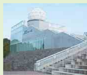
▲気象観測の歴史を展示する富士リーダードーム館

富士山麓に位置する富士学園は、四季折々の豊かな自然の中で日ごろの疲れをいやせる施設です。また、館内には体育館・研修室があり、団体の貸切利用に適しています。施設の近くには、忍野八海をはじめ、河口湖や山中湖など季節の移り変わりが楽しめる観光名所も数多くありますので、ぜひ、お越しください。