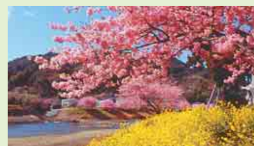
▲春の訪れを告げる河津桜と菜の花(2月上旬から見ごろ)