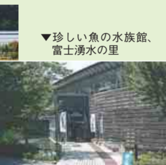
▼珍しい魚の水族館、富士湧水の里