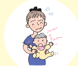
子育てがうまくいかない