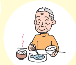
一人暮らしの高齢者で不安だ