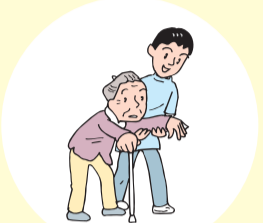
体が不自由で困っている