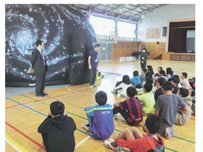
▲学校での上映会の様子

時 5月16日(土)・23日(土) / いずれも午後1時30分、2時30分、3時30分 場 セッション杉並（梅里1-22-32） 定 各回50名（先着順。開始時間の各30分前から整理券を配布） 費 無料（申 当日、直接会場へ） 保 社会教育センター ☎3317-6621