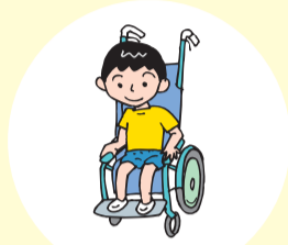
車椅子を借りたい

相談の内容に応じて子ども家庭支援センター、地域包括支援センター（ケア24）などの関係機関への橋渡しをします。