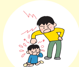
もしかして児童虐待？