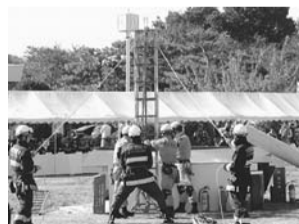
▲25年度の杉並区総合震災訓練