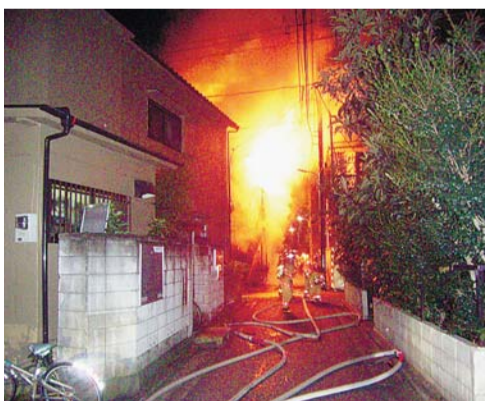
▲地震は火災を引き起こします。特に杉並区では木造住宅密集地域などでの火災の延焼拡大が危惧されています

区は、大震災は必ず起きるとの認識に立ち、木造住宅密集地域の不燃化対策や耐震改修の促進、災害時要援護者の支援など、首都直下地震に備えた防災・減災対策についてスピード感を持って進めてまいりました。 そしてこの度、東京都と初めて合同で訓練を行うこととなりました。都区合同総合防災訓練は、関係機関 団体と区民の皆さんとともに実践的な訓練を通して、区の震災対策の充実、また地域防災力の向上を図る、大変重要な取り組みであると同時に非常に良い機会であると捉えています。 首都直下地震での区の被害は、建物全壊3692棟、焼失棟数2万3028棟、死者数556人と想定されています。 私は、3・11東日本大震災の時、南相馬市での大規模災害の脅威を目の当たりにし、災害が起きる前に被害を極力少なくする対策と準備がいかに大切であるかを学びました。区はこの数字を下げるために、全力で取り組んでいます。これらの取り組みと合わせて、区民の皆さん一人一人が「自分たちのまちは、自分たちで守る」という気持ちをもって、日頃から備えをしていただくことが、さらに数字を下げることに繋がります。 訓練に参加することを通じて、いざというときの行動力や対処力を学び、力を合わせて防災・減災に取り組ましましょう。多くの皆さんのご参加・ご来場をお待ちしています。