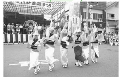
▲東吾妻ふるさと祭

区の交流自治体である群馬県東吾妻町では、東吾妻町の自然・歴史・文化・温泉・物産・観光スポットなどをPRし、各イベントなどに積極的に参加してもらう「東吾妻町観光サポーター」を募集しています。