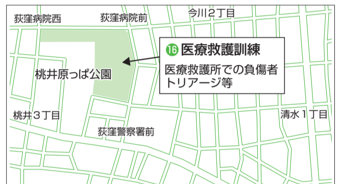
〈26年度東京都・杉並区合同総合防災訓練 会場別訓練実施時間〉