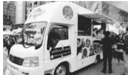
▲台湾料理専門店のキッチンカー登場

時午前11時～午後4時 台湾の観光紹介、パイナップルケーキ・台湾茶などの物産販売、中学生野球交流のパネル展示、キッチンカーでの屋台料理、タピオカティーの販売(申込当日、直接会場へ)