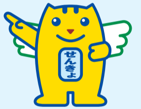
▲選挙のイメージキャラクター 選挙のめいすいくん

暮らしの中で最も身近な代表者を選ぶ大切な選挙です。住みよい杉並をつくるため、あなたの1票を忘れずに投票しましょう。 ——問い合わせは、選挙管理委員会事務局へ。