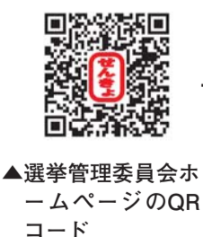
▲選挙管理委員会ホームページのQRコード

▽選挙管理委員会 http://www2.city.suginami.tokyo.jp/poll/kucho2014/top.asp ▽選挙管理委員会モバイル版 http://www2.city.suginami.tokyo.jp/mobile/senkyo/kucho2014/election.asp