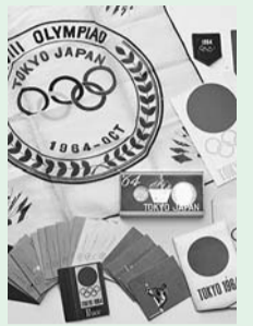
協力：公益財団法人日本オリンピック委員会

郷土博物館分館では、1964年に催された第18回東京オリンピックに関する展示を、今年の9月20日～12月7日に行います。当展示では、区民の皆さんの東京オリンピックに関する記念品や写真等のグッズのほか、当時の思い出話なども紹介します。