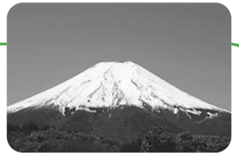
▲施設付近から見た富士山

●●下表のとおり●集合・解散場所=JR荻窪駅・阿佐ヶ谷駅、京王線明大前駅●●電話で、あんしん宿予約センター ☎0120-844-891(午前9時~午後5時)へ●最少催行人数=各20名