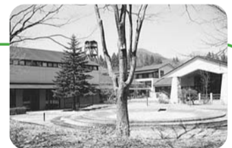
▲コニファーいわびつ