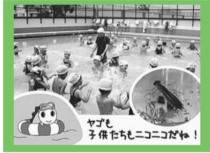
ヤゴも子供たちもニコニコだ！

梅雨が明け、子供たちの笑い声がひときわ賑やかに聞こえてくると、もうすぐ夏本番！ 太陽の下、プールでひと泳ぎしたくなりませんか？ 区内にある半数ちかくの小学校では、プール開きの清掃前に「ヤゴ救出」活動が行われています。一昔前まで屋外プールでふ化したヤゴ（トンボの幼虫）は、そのまま下水に流されていたのですが、平成12年頃から環境学習の一環として「ヤゴ救出」がスタート。昨年度は20校が実施しました。