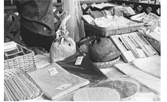
▲小千谷縮を使った小物も販売♪

●7月2日(水)午前10時~午後2時●特産品販売=区役所中杉通り側入り口前▷小千谷縮展=区役所1階ロビー●申込当日、直接会場へ●文化・交流課交流推進担当●買い物袋を持参してください