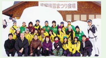
▲昨年参加された皆さん

北塩原村で2月21日(金)～23日(日)に開催される「裏磐梯雪まつり2014」にあわせて、区内の若者を対象とした交流ツアーを今年も北塩原村と共同で企画しました。今回は、裏磐梯雪まつりの企画案をグループワーク等を通して作ります。まちづくりやイベント企画に興味がある方、新たな一歩を踏み出したい方、お待ちしております。新しい自分に出会えるはずです。お一人での参加も大歓迎。