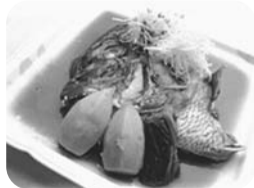
ホロホロと柔らかかな鯛のカプト煮

区施設としての予約は、26年3月30日宿泊分まで可能になりました。詳細・申し込みは、電話で「湯の里 杉菜」☎0120-465-002へ