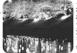
夜桜☆流れ星 天の川プロジェクト