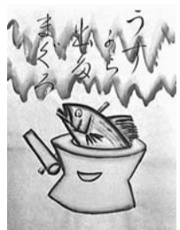
▲地口 うすからでたまぐろ

区内の初午行事では、地口と呼ばれるダジャレをきかせた行灯を飾っていました。あなたの考える面白おかしい新作地口を募集します。作品は、企画展「ことば・絵・あそび～初午と地口行灯」で展示します。