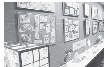
▲庚申文化会館での展示

高円寺北庚申文化会は、JR高円寺駅北口からすぐの高円寺北2丁目、3丁目にまたがったところにある、大変にぎわった町です。町会のまんなかに商店街(高円寺庚申通り商店街)があり、買い物客でとてもにぎわっています。商店街では、年4回高円寺全域でのイベント(高円寺演芸祭・高円寺大道芸・高円寺阿波おどり・高円寺フェスタ)が行われ、一年中何かイベントを行っています。そのような町なので犯罪のない、事故のない町にするため、日夜、庚申パトロール隊が見回りを努力しています。今年になって防犯カメラを6台まで増設し、監視も強化しています。町会活動としては、2年前に町会会館(庚申文化会館・3階建て)を建設し、1階にはギャラリーを創設、2階・3階には会議室と町会事務所を設け、会員