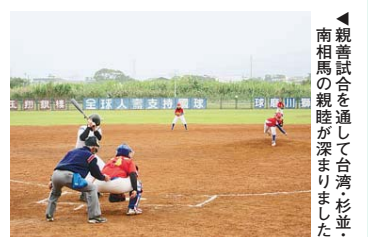
◀親善試合を通して台湾・杉並・南相馬の親睦が深まりました

杉並区中学生軟式野球チーム「オール杉並」の選手34名と南相馬市中学生軟式野球チーム「オール南相馬」の選手15名は23年12月23日(祝)～26日(月)で台湾を訪問し、親善試合を6試合行い、「オール杉並(2チーム)」は3勝1敗、「オール南相馬」は2引き分けの成績を収めました。