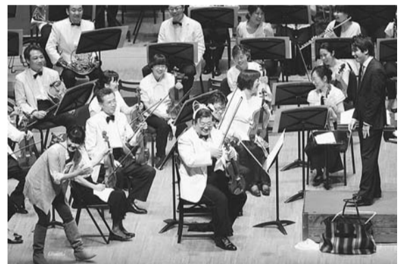
▲日本フィルハーモニー交響楽団 オーケストラ探検「四季」の巻より (23年8月13日杉並公会堂大ホール)