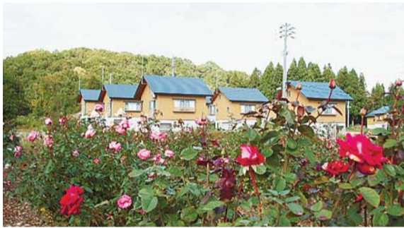
▲ボランティアの方が栽培しているバラ園