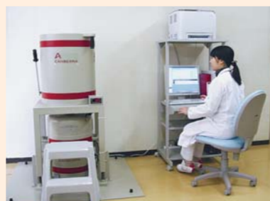
▲ゲルマニウム半導体検出器での測定

自前の検査機器を導入することで、検出限界値を下げた区独自の詳細な測定や臨時の対応が可能となります。また、水道水も検出限界値を下げて測定を継続します。学校や保育園等の給食・食材等については、順次測定し、結果は後日、区ホームページなどでお知らせしていきます。