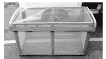
▲ごみ収集ボックス

※カラス対策用「ごみ収集ボックス」は使用後は必ず片付けてください。なお、申し込みの際は、集積所を使う人皆さんの合意が必要です。