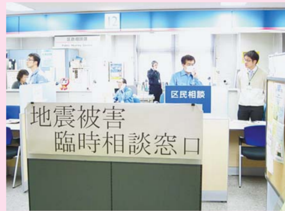
▲地震被害臨時相談窓口