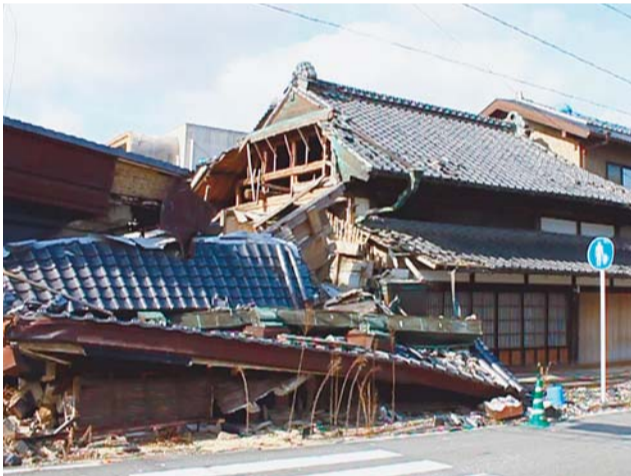
▲震災の傷あとが残る福島県南相馬市小高区(警戒区域)の現状(24年1月19日撮影)

甚大な被害からの復興は長期にわたることが予想されますが、今後も区は、南相馬市等被災地の支援に全力で取り組んでまいります。