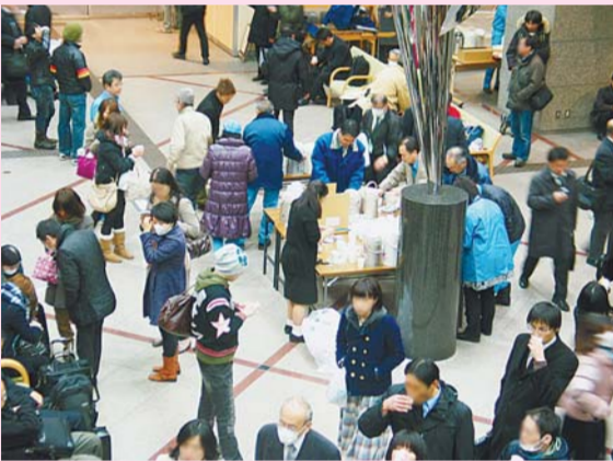
▲帰宅困難者の受け入れ