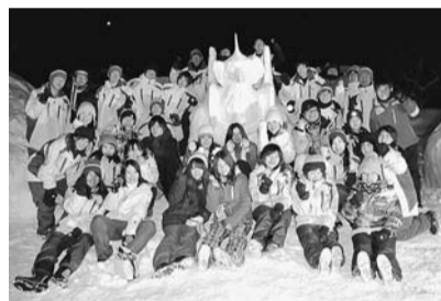
▲今回のツアーに参加した学生たち

そのほかにも、スキー・スノーボード・スノーシューや、村の方による体験談、「風評被害に対して何ができるのか」についてのグループ討議などさまざまな体験を通して、学生たちは、北塩原村の魅力を存分に味わい、村民の思いを共有し、村との強い絆を築いていました。学生たちの歓喜と決意あふれる姿に、未来への希望を感じる、素晴らしいツアーとなりました。