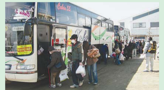
▲避難者を東吾妻町へ(23年3月17日)