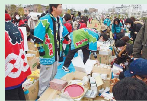
▲南相馬市支援チャリティーバザー(23年4月3日)