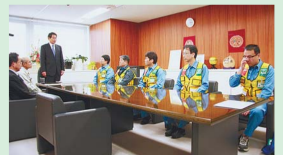
▲杉並区職員の派遣(23年4月8日)