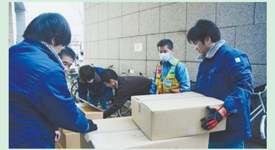
▲支援物資を南相馬市へ(23年3月15日)