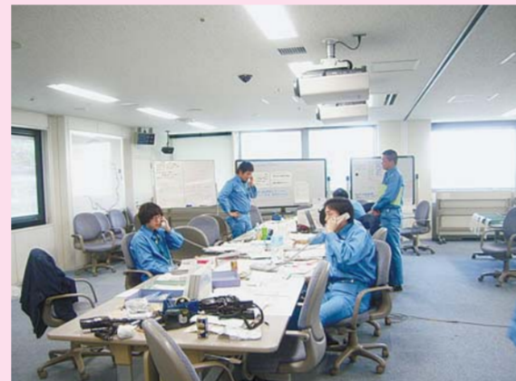
▲杉並区災害対策本部での電話対応