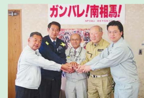
▲自治体スクラム支援会議(23年5月15日)

今回の東日本大震災では、災害救助法に基づく旧来からの国や県を通じた被災地支援に限界が感じられました。そこで、杉並区が同じく災害時相互援助協定を結ぶ、群馬県東吾妻町・新潟県小千谷市・北海道名寄市・杉並区の4つの基礎自治体で、23年4月8日(金)に「自治体スクラム支援会議」を立ち上げ、基礎自治体同士が主体的に連携して、迅速できめ細やかな支援を行っていくこととしました。以後、自治体スクラム支援会議では、南相馬市の復旧・復興状況を踏まえつつ、その時機に即した支援内容の検討や、国の法制度や財政措置などの仕組みの見直しについて、要望活動などを行っています。