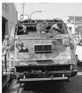
▲スプレー缶が原因で、清掃車両の火災が発生

スプレー缶・カセットボンベの高圧ガスやライターの花火が原因で、清掃車両の火災が発生しています。出し方をご確認いただき、火災防止にご協力ください。