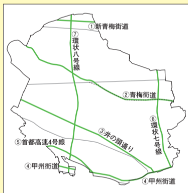
▲区内の特定緊急輸送道路

杉並区耐震改修促進計画に基づき、区立施設を含む区内の建築物の耐震化を進め、区内の住宅・建築物の耐震診断・改修を促進し、耐震診断・改修工事費の一部を助成します。あわせて、地震発生時に緊急輸送道路等に係る沿道建築物の倒壊による道路の閉塞を防ぎ、避難路と輸送路を確保するため、広域的な特定緊急輸送道路(※3)も含め沿道建築物の耐震化を促進します。