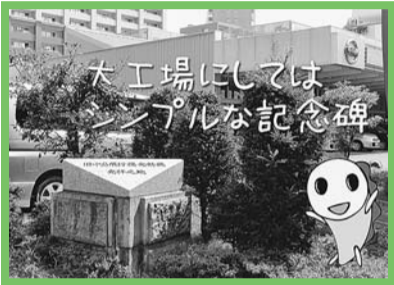
ウェブサイトで もあつたよ! すぎなみ学 検索

た国産自動車性能試験がその頃の一番の思い出だそうです。皇居前を出発し、京都で折り返し、小平市にあった通商産業省(現:経済産業省)の試験場で最終テスト、日野自動車の工場では自動車を分解して評価しました。