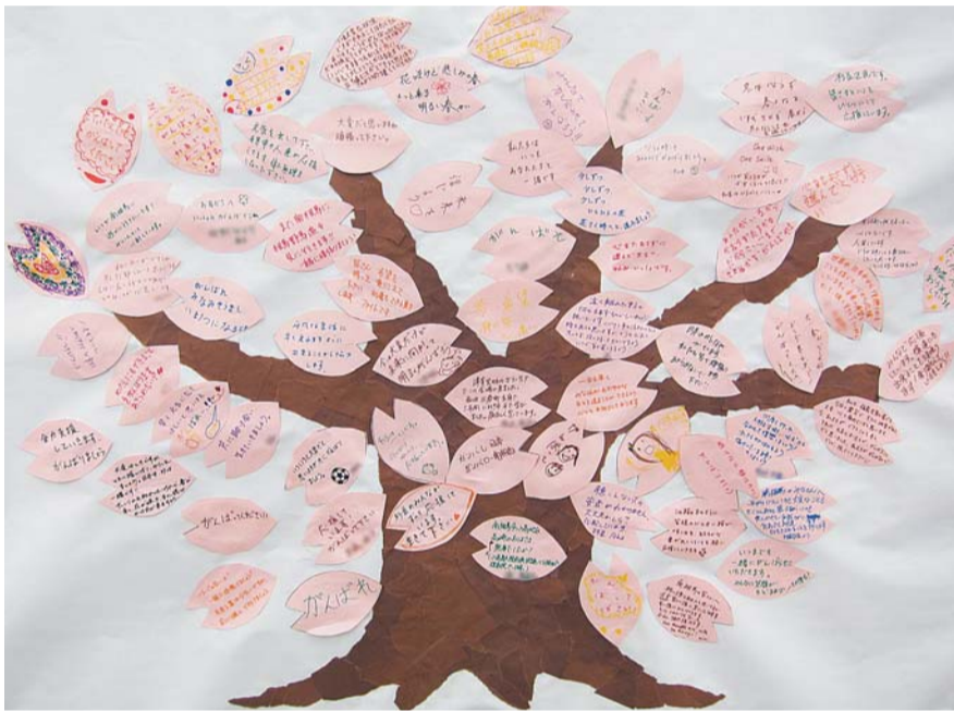
▲4月3日のチャリティーバザーでは、南相馬市の市の花「サクラ」をかたどったメッセージボードに、多くの応援メッセージが寄せられました

東日本大震災で、区と交流があり「災害時相互援助協定」を締結している福島県南相馬市に甚大な被害が発生しました。区は、被災地への必要な支援に全力を尽くしていきます。