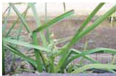
▲ナガエミクリ(水生植物)