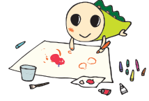
「なみすけ原画展」も同時開催

【日時】 1月29日(土)～2月13日(日)午前9時～午後5時 (土・日曜日とも入場できます。2月11日(祝)は除く) 【場所】 区役所2階区民ギャラリー 【申し込み】 当日、直接会場へ