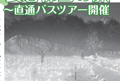
▲裏磐梯エコナイトファンタジー

2月、裏磐梯には見渡す限りの真っ白な銀世界が広がります。湖面が氷結してできたキャンパスに灯る3000本のキャンドルは息をのむ美しさ...。灯した数だけ天使が舞い降りて幸せになると言われています。大自然を舞台に幻想的な夜を過ごしませんか。