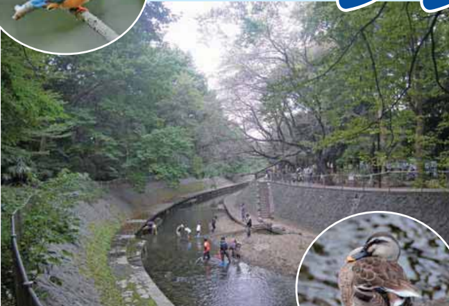
▲「善福寺川発見イベント」での生き物調査