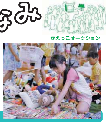
かえっこオークション

【日時】 2月6日(日) 午後1時～4時 【場所】 セシオン杉並 (梅里1-22-32) 【参加費】 無料 【申し込み】 当日、直接会場へ (ホールの催し「つくるじかん」は事前申込制) 【問い合わせ】 環境都市推進課または東京ガス(株)西部支店 ☎3396-2192