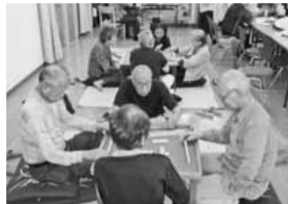
▲普段の交流も広がっています

地域貢献活動では、毎月第4日曜日に集会所を開放して、近隣の方と一緒に、麻雀・お茶会などを行い、幅広い年齢層の方が楽しく交流しています。 防犯対策としては、防犯パトロール隊を結成し、団地周辺だけではなく井草森公園も見回り範囲としています。他