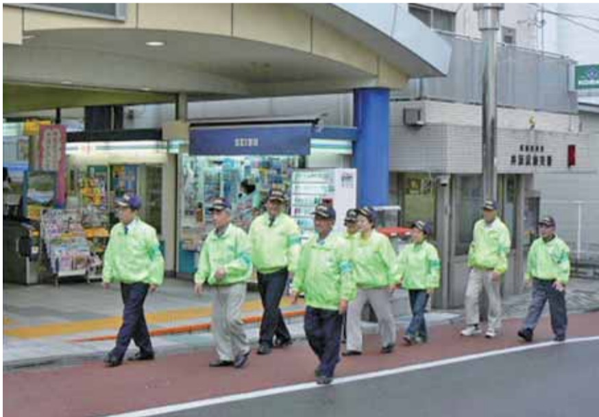
▲防犯パトロールで地域の安全を見守っています

いま、高齢者や児童などの見守りを含めた地域の支え合い(共助)の大切さが改めて注目されています。そこで、地域コミュニティの中心的存在である町会・自治会の活動についてご紹介します。