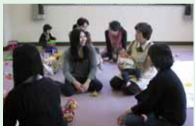
▲民生・児童委員が参加している子育てサロンの様子(上井草保健センター)

地域の皆さんが住みなれた町で安心して暮らすことができるよう、住民の立場に立った相談、援助を心がけています。また、高齢の方や障害をお持ちの方などが孤立しないように、心の援助をすることも「顔の見える関係づくり」を進めていきます。一人で悩まずに、まずはお電話ください。私たちは皆さんの地域の身近な相談相手です。