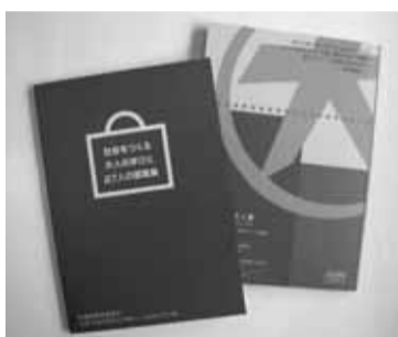
▲夜コース記録集「社会をつくる大人の学びと27人の提案集」

昨年度の夜コース記録集ができました(左写真)。ご希望の方は、お問い合わせください。また、昼コース受講生が学びをつづけた本「縁育て」の楽校くみんが輝く生涯学習実践記」は6月に出版予定です。