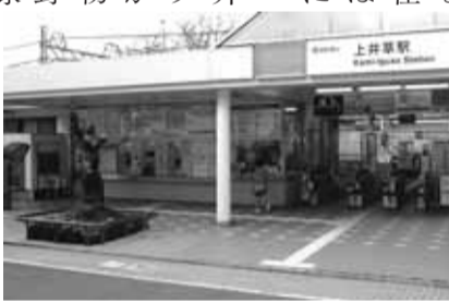
▲ガンダムモニュメント…月2回地元の小中学生の有志が清掃しています

上井草自治会は、区の北側に位置し北は練馬区と接しています。戦時中からお隣の今川町と一緒に「今川上井草町会」として共に歩んできました。しかし、住民の増加と共に昭和26年に今川町と別れ、「上井草自治会」として発足し現在に至っています。 そのころから次第に西武新宿線 上井草駅を中心に商店も増えて「まち」に活気が出てきました。そして今ではテレビ番組でも取り上げられるほどになり、現在の自治会会員数は約1000世帯になります。 地域内には上井草スポーツセンターがあります。かつてここは日本初の本格的なプロ野球場がありプロ球団や六大学野球の活動の場所でした。今では区の総合スポーツ施設として年間40万人以上の人々に利用されています。駅周辺には世界的な人気アニメ「機動戦士ガンダム」の製作会社(株)サンライズ本社があり、上井草駅頭には「ガンダムモニュメント」が建立されています。「ガンダム」のいる街」として全国的に上井草が有名になりファンが訪れています。また平成14年には名門早大ラグビー蹴球部が東伏