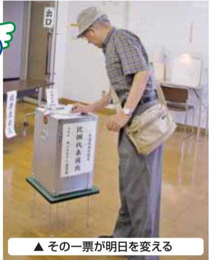
▲ その一票が明日を変える

参議院議員選挙では東京都選出(改選数5)と比例代表選出(改選数48)の2選挙を投票します。また、杉並区長選挙・杉並区議会議員補欠選挙は暮らしの中で最も身近な代表者を選ぶ大切な選挙です。あなたの一票で住みよい「すぎなみ」をつくるため、忘れずに投票しましょう。