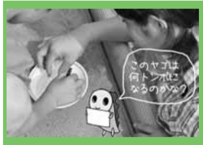
ウェブサイトで検索

「ヤゴ救出大作戦」という言葉をご存じですか？ 実はこれ、初夏の杉並の風物詩と言っても過言ではありません。屋外プールはオフシーズンも防火用水としてため置かれ、トンボの産卵場所となります。ふ化したヤゴが排水と共に流れ