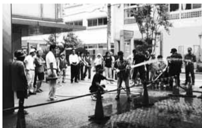
▲小型D級ポンプでの消火演習

荻窪駅南口から東に一プロック過ぎたところから、中央図書館・読書の森公園に隣接する地域。大きな木立と静かな庭園を有する大田黒公園、その周辺の緑の多い住宅街とマンションやアパートの混在する町が、荻窪東町会です。この町に住む人たちが、元気で安心して暮らせるまちづくりを漠然と考えていた時、「まちの絆(なまな)向上事業」の助成金のお話を聞きました。現役世代の地域住民による組織作りを20年度の重点事業とし《まちの安心援助隊育成講座》として助成金を交付していただくことになりました。 大地震などの災害はいつ・どこで・どのような形で私たちの身近に起こるか予測することはできません。しかし、起きたときを想定し方が一に備えることは今でもできます。お年寄りの多いこの町で、皆がまとまり一人でも多くの命を救える手助けをしていただける人を一人でも増やしたい。そんな希望を持って進めた事業でした。20年7月には杉並保健所口ビーで、消火体験・演習、担架・背負いひもによる傷病者の避