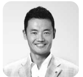
中田 宏 氏(横浜市長)