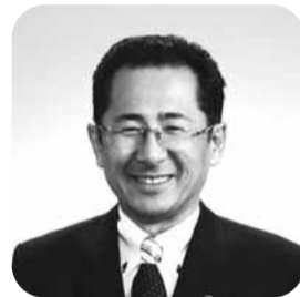
海老根 靖典 氏(藤沢市長)