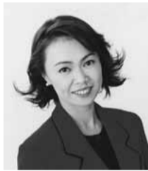
細川珠生氏 (政治ジャーナリスト)