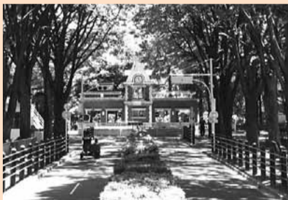
▲杉並児童交通公園

信号機や、踏切のある園路を自転車やゴーカートで走ることができます。遊びながら交通ルールが学べる公園です。夏休みの間、閉園時間を午後6時に延長します。