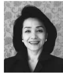
櫻井よしこ氏 (ジャーナリスト)