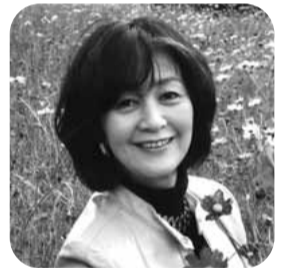
須磨 佳津江 氏(キャスター)