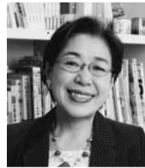
荻原博子氏 (経済ジャーナリスト)