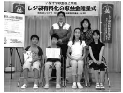
いなげや桜上水店から高井戸第三小学校へピオトープ看板などが贈られました

スーパーいなげやの杉並新高円寺店と杉並桜上水店は、レジ袋有料化による収益金で、堀之内小学校に「緑と野鳥の掲示板」を、高井戸第三小学校に「ピオトープ看板等」を寄贈しました。6月22日に堀之内小、29日には高井戸第三小で贈呈式が行われました。 問環境都市推進課