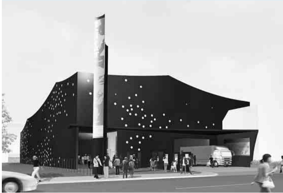
▲皆さんに愛され親しまれるような愛称をお待ちしています(杉並芸術会館完成イメージ)

区は現在、旧区立高円寺会館跡地(高円寺北2-1-2)に、「杉並芸術会館」を建設しています。建築工事は20年11月末まで行われ、21年5月に開館予定です。地域に根ざした芸術文化活動の拠点として、多くの方々に愛され、親しまれるような愛称を募集します。 — 問い合わせは、区民生活部管理課施設設計画担当へ。