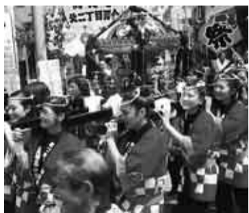
▲一層盛り上がる女神輿

町会には、ボランティア活動に登録している会員が多くいます。「すぎなみ公園育て組」、「自転車放置防止協力員」、「違反広告物除却活動協力員」の活動により、公園や花壇がきれいに保たれ、町内