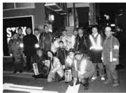
▲地域の安全を守ります