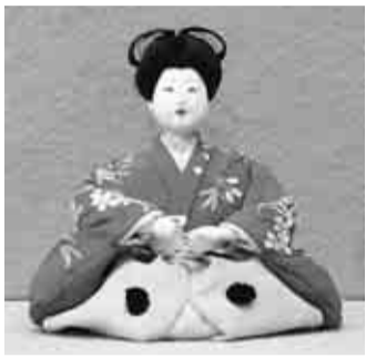
▲嵯峨侯爵家ゆかりの初参人形

嵯峨侯爵家ゆかりの初参人形・御所人形、伊勢神宮の遷宮の部材で作ったとされる大きな御所飾りのひな人形、浦島太郎や花咲か爺さんのおとぎ話を題材にした浮世物の人形など、貴重な人形が一堂に会します。また、古民家にも例年通りひな人形の段飾りを展示します。