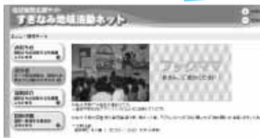
団体の公開用ホームページ(イメージ)