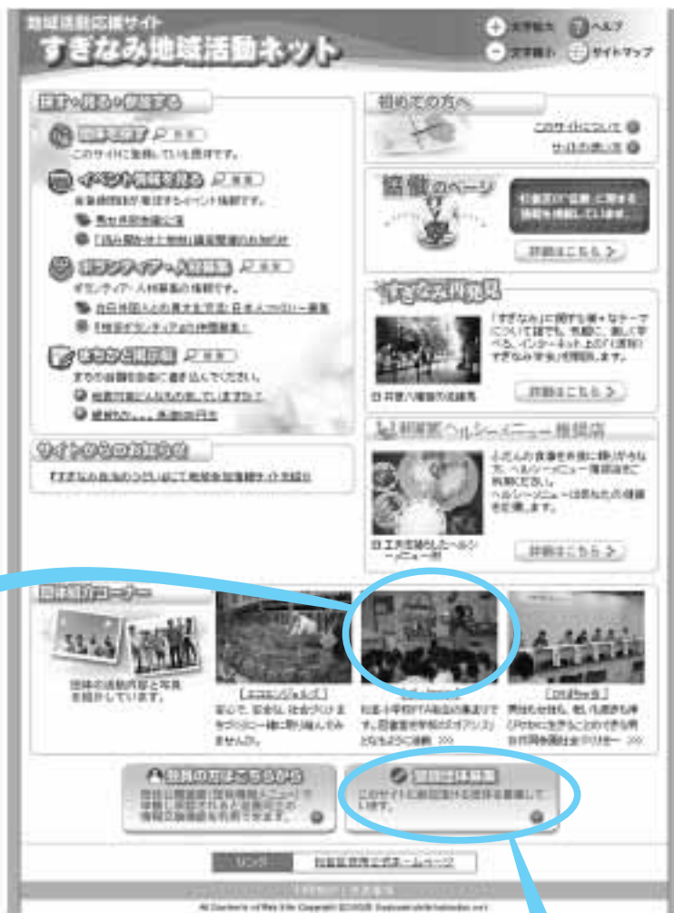
トップページ(イメージ)