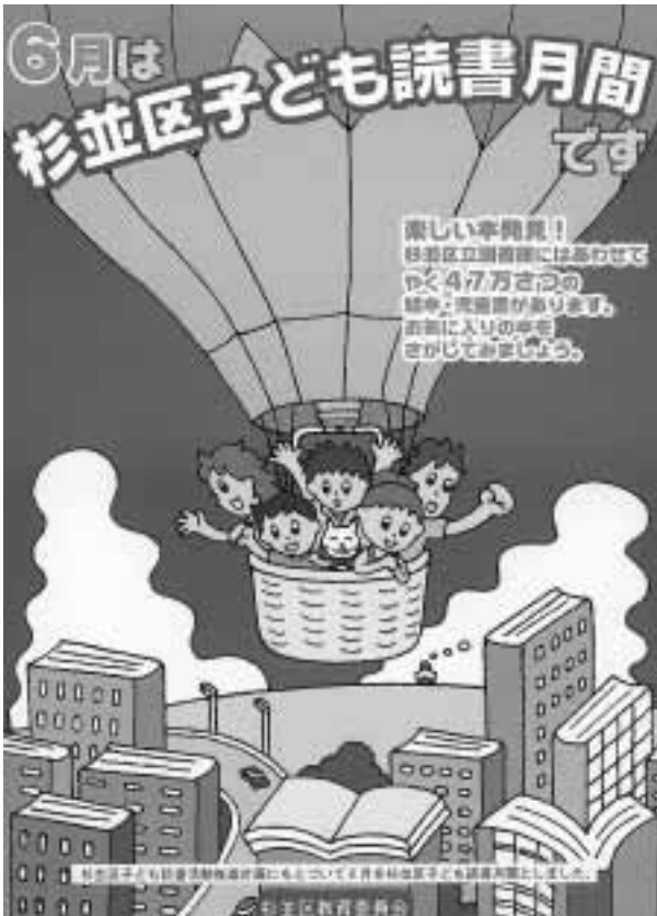
杉並区子ども読書月間ポスター