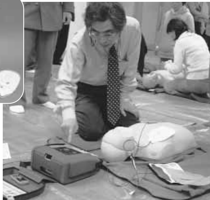
職員も訓練しています