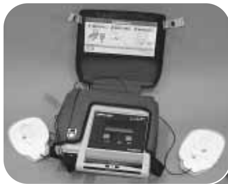
AED Automated = 自動 External = 体外式 Defibrillator = 除細動器