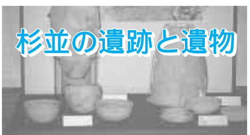
杉並の遺跡と遺物

源および湧泉を伴った小池 がある。飲料水を地表水 に依存した縄文文化人に は、この小河川流域の陽 当たりの良い台の上は絶好 の居住地であったと考え られる。 縄文文化前期末から中 期にかけての出土品は急 激に増加した。善福寺川 右岸熊野神社の境内、和 田堀公園、神田上水左岸 久我山4丁目立教女学院 図書館付近では土器片が かなり出土している。下 高井戸5丁目塚山遺跡で