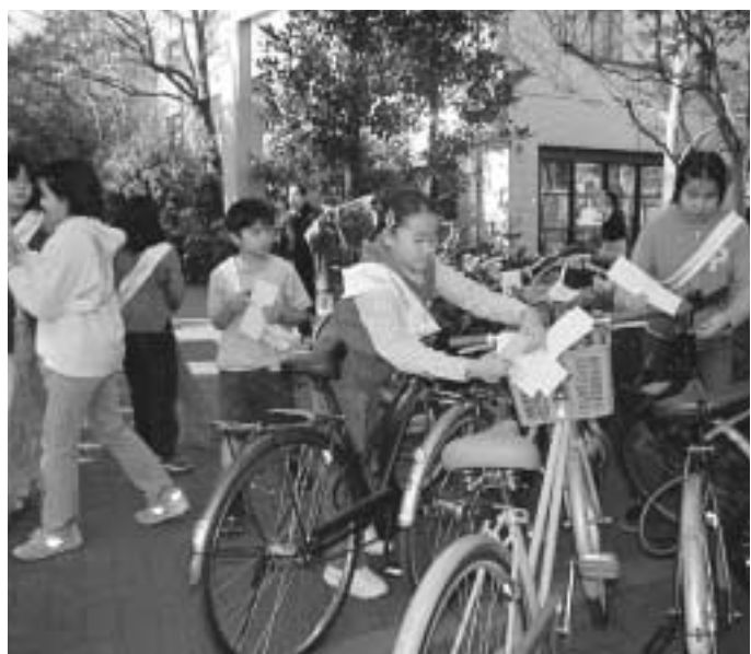
放置自転車には「禁止ホルダー」を！

西荻窪のお風呂屋さんの仕事を体験した、男の子三人組に感想を聞いてみました。行った先のお風呂屋さんには、マッサージ・サビスを受けたら、飲食もできる健康ランドのようなところ。思っていたより地味な仕事が多くて、三人はびっくり。「洗濯屋さんから戻ってきたタオルを五百枚、延々とたたむんですよ。あれは大変だったなあ」。でもそういう仕事でも、時間はあっという間に経ったといえます。楽しかった仕事を聞く