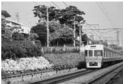
井の頭線の緑化 (高井戸西1 36ほか) 京王電鉄では、法面保護のため、10年程前から「グリーン作戦」を計画し植栽に努めています。線路両側に咲く花は、乗客・地域の人々にうるおいとやすらぎをもたらしてくれます。