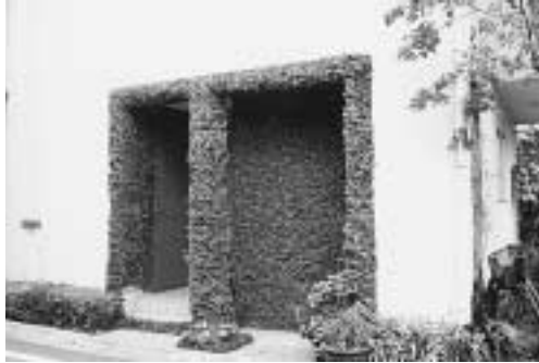
善福寺の住宅 (善福寺1 11) 白い壁とブミラに覆われた玄関が印象的な住宅。玄関先には、低木や季節の鉢物を飾り、壁面緑化とともにみどりの玄関を演出しています。

杉並「まち」デザイン賞は、皆さんと一緒に杉並らしいまちなみづくりを考え、うるおいある美しいまちを形成していくため行っています。 今回は、五八件の推薦・応募があり、選考委員会での審査を経て、五件が選ばれました。 問い合わせは、まちづくり推進課へ。 ※受賞対象の写真は、1月31日～2月6日に、区役所一階ロビーで展示されます。