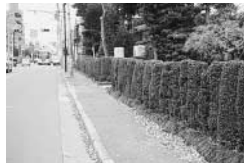
五日市街道の生垣 (西荻南1 3) 30m以上も続くツゲの生垣。高さや形状など、一本一本のツゲの特徴を生かすように刈り込みがされ、通りを行く人の心を和ませてくれます。

① 説明会 入会を希望される方、関心のある方は、説明会へご出席ください。日程は下表のとおりです。 ② 面談・登録 利用会員は、区内在住・在勤の方でおおむね10歳までの子どもを持つ方。協力会員は、20歳以上で心身ともに健康で子育てに意欲のある方。