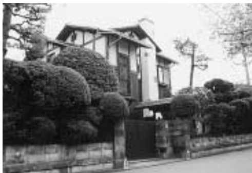
南荻窪の住宅 (南荻窪3 3) 昭和初期に建てられた住宅。丸窓・ステンドグラス・暖炉の煙突など、建築当時の意匠を大切に維持し、昔のまちの面影を伝えています。