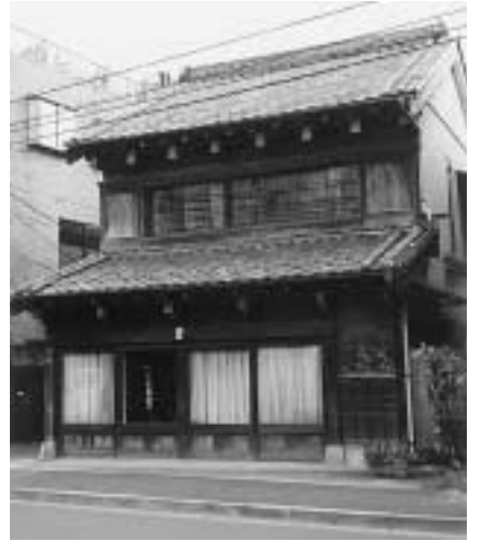
松庵の民家 (松庵2 2) 昭和初期に建てられた出し桁造りの建物。引き戸・格子・戸袋など、建築当時のまま残っているのは珍しく、まちなみに年月の深みを与えています。

杉並「まち」デザイン賞は、皆さんと一緒に杉並らしいまちなみづくりを考え、うるおいある美しいまちを形成していくため行っています。 今回は、五八件の推薦・応募があり、選考委員会での審査を経て、五件が選ばれました。 問い合わせは、まちづくり推進課へ。 ※受賞対象の写真は、1月31日～2月6日に、区役所一階ロビーで展示されます。