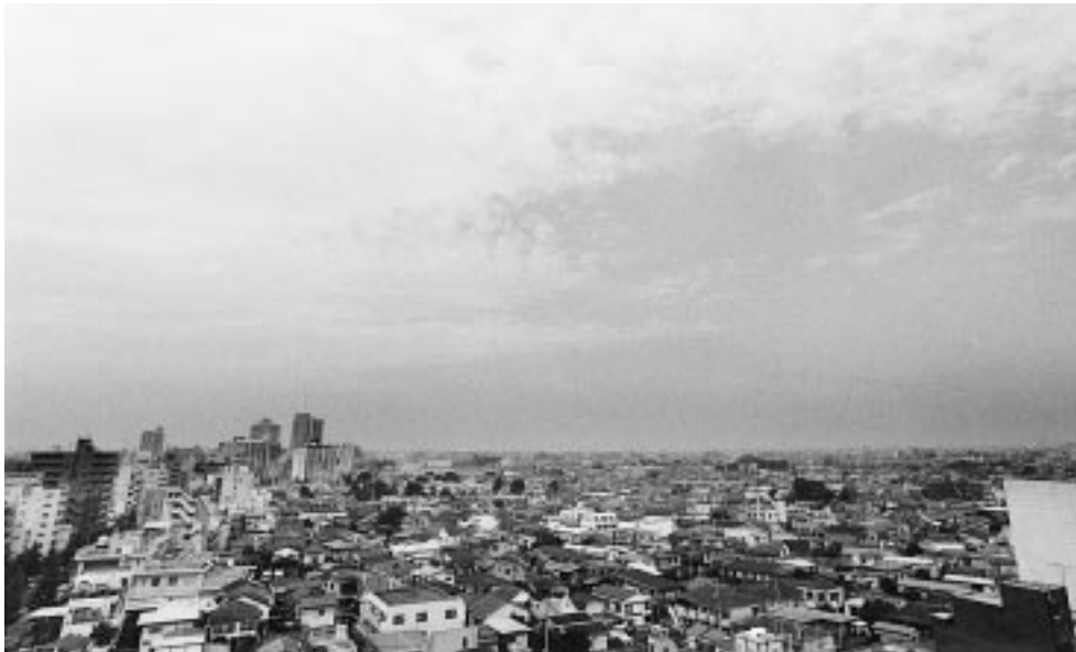
一人ひとりが生活を見直し、行動することで、地球環境を守ることができます。