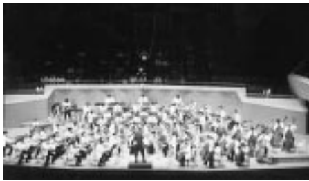
日本フィルハーモニー交響楽団

販売窓口は、文化振興協会(電話予約可) 近畿日本ツーリスト区役所内 区内各地域区民センター 取扱時間は、月、金曜日(祝日は除く)の午前9時~午後5時(地域区民センター)