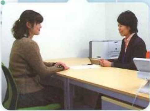
落ち着いた雰囲気個室で相談ができます。