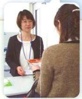
まずは総合案内にお立ち寄りください。