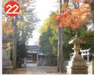
22 荻窪八幡神社 旧上荻窪村の鎮守で1100年ほど前の寛平年間に建立されたと伝えられ、太田道灌が植えたと言われる「道灌榎」がご神木です。