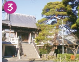
3 光明院 通称「荻寺」と呼ばれ荻窪の地名の由来と言われています。本堂は1850年の再建で、多くの文化財や石仏があります。