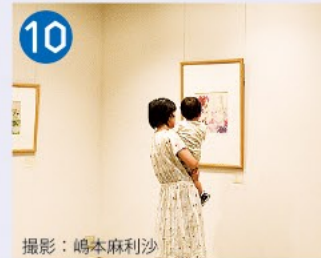
10 ちひろ美術館・東京 絵本画家いわさきちひろの没後3年の1977年に、ちひろの業績を記念し、自宅兼アトリエ跡に絵本の美術館として開館しました。