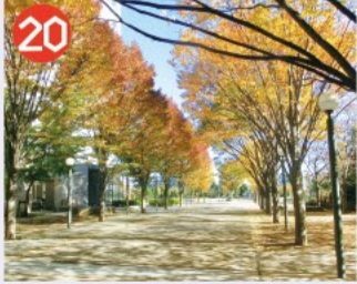
20 プロムナードの並木 青梅街道から原っぱ公園まで200mけや並木が続いており、周囲の大きな建物群と落ち着いた調和を見せています。