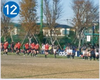
12 早大上井草グラウンド ラグビー用グラウンドで練習や試合に使われています。エントランス広場では地域の夏まつりやアニメまつりなどが開催されます。