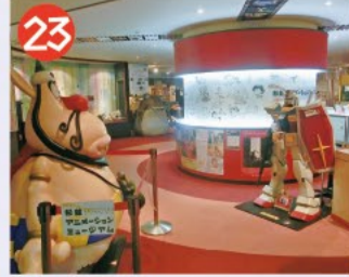
23 東京工芸大学 杉並アニメーションミュージアム アニメの歴史や原理を学んで企画展なども開催される子どもから大人まで楽しめる施設です。