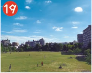
19 桃井原っぱ公園 かつてゼロ戦のエンジンを設計・製造した地に、平成23年に公開された災害時の拠点も兼ねた公園で、広い芝生が象徴的です。