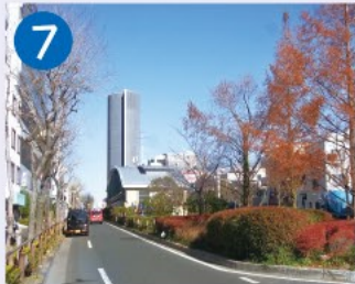
7 環八通り井荻トンネル 井荻駅の南北1kmはトンネルになっており、地上の中央部は樹木や草花の植えられた緑地にもなっています。換気塔もみえます。