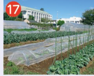
17 都立農芸高校 校舎の建つ敷地の周囲に野菜・果樹・草花・庭園実習などを実施する多くの農場を有しており、広い緑の空間となっています。