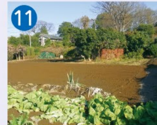
11 屋敷林 この地域には農地とともにうっそうとした屋敷林があちこちに残されており、地域や住人に潤いと安らぎを提供しています。