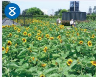
8 井草森公園 旧機械技術研究所の跡地につくられた、原っぱ・水と森・運動場のゾーンに分かれた公園で、一面は広いお花畑になっています。