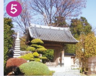
5 妙正寺 1352年に妙正寺池のほとりに建てられたお堂が始まりで、三代將軍徳川家光が鷹狩の折に立ち寄り、ご朱印寺として有名になりました。