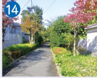
14 井草川遊歩道 旧井草川が散策向けの緑道として整備され、一部は小柴博士を記念した科学と自然の散歩道となっています。