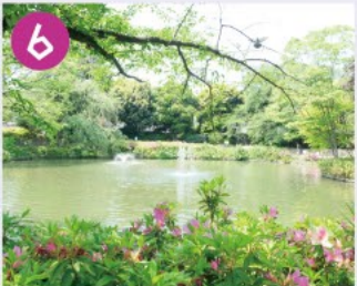
6 妙正寺公園 妙正寺池を中心にした緑豊かな公園で、冬には多くの水鳥が飛来してきます。つつしが多く植えられ四季折々の花も楽しめます。