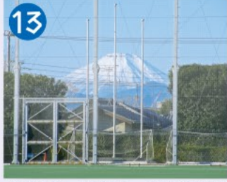
13 上井草スポーツセンター 東京都が水道貯水池の上に建設した総合運動場(1967年完成)で、現在は区営スポーツセンター。運動場から富士山が望めます。