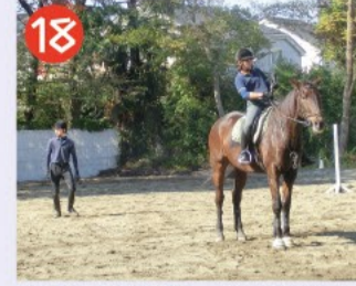
18 都立農芸高校馬場 農芸高校のアイドルとなっている馬が走る姿を見ることができます。