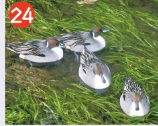
24 善福寺川 善福寺池を源流とし中野区との区境で神田川に合流しますが、比較的川幅が広く水量も豊富で、水草も生え、多くの水辺の鳥が飛んできます。