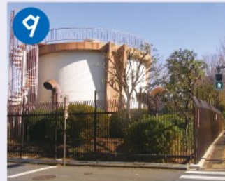
9 水道局貯水水槽 上井草スポーツセンター地下の給水池から杉並・練馬に水道水が送られますが、停電時などの衝撃から配管を守るための水槽です。