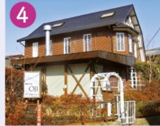
4 ビストロ・オチ 大正時代に四国から大工さん呼び、緑豊かなこの地に建てられた住宅で、生垣や花の咲く庭が道行く人を楽しませてくれます。