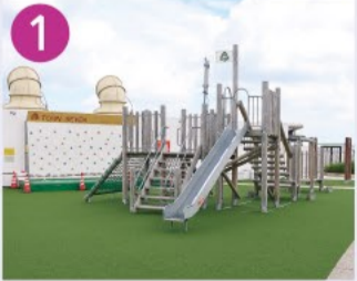
1 タウンセブン 戦後の新興マーケットが1981年に7階建てビルになりました。屋上から富士山が見え、子供たちを遊ばせる遊具が揃っています。