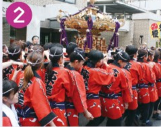
2 荻窪白山神社 旧下荻窪村の鎮守で、かつては面の神様として知られていました。大神輿と太鼓が有名です。