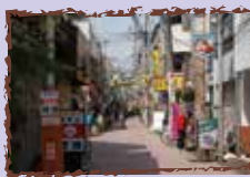
あづま通り商店街