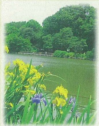
・写真は何れも 地元の宝・善福寺池