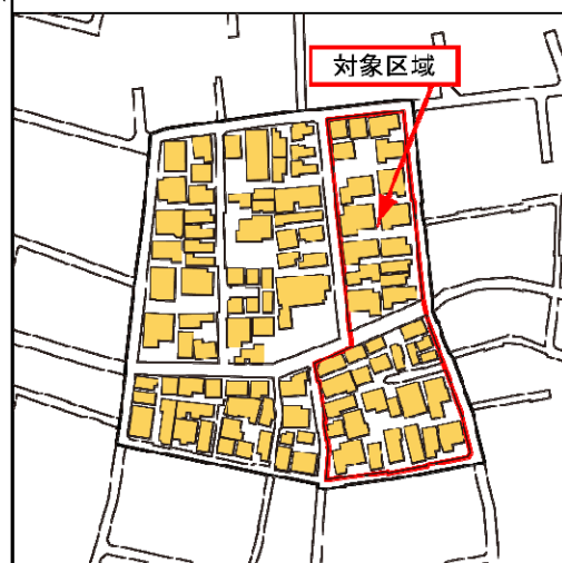
阿佐谷南2-11の対象区域図