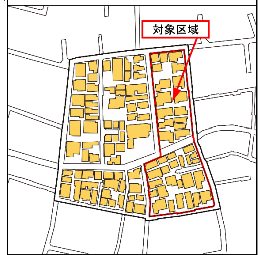
阿佐谷南2-11の対象区域図