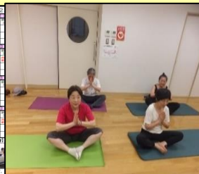
登録団体の活動紹介