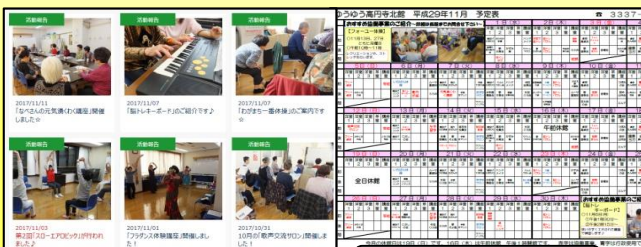
各種協働事業の紹介