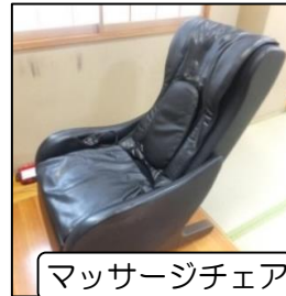
マッサージチェア