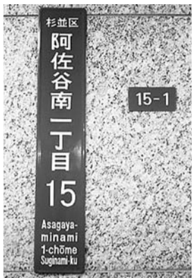
▲住居番号表示板(右)、街区表示板(左)

住居番号表示板(えんじ色。縦6cm×横12cm程度の横書き)は、住居表示をより分かりやすくするために、各戸の出入り口付近に貼り付ける表示板です。老朽化している表示板を持っている方、また、表示板を持っていない方には、新しいものをお渡ししています。 街区表示板(縦66cm×横12cm程度の縦書き)は、町名等(例=杉並区阿佐谷南一丁目15)を表記したプレートです。担当職員が街区の角に貼り付け、交換しています。いずれも設置を希望する方は、お問い合わせください。