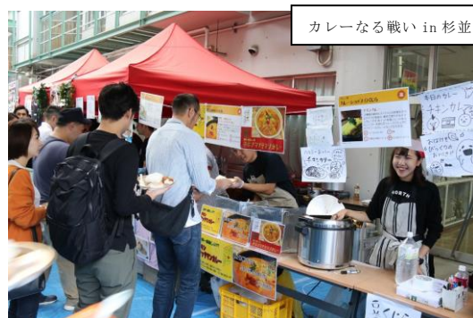
カレーなる戦い in 杉並