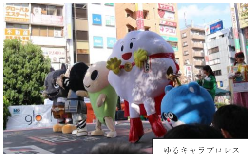
ゆるキャラプロレス

特設のプロレスリングが設置された駅前北口広場では、このリングを舞台にアイドルライブやプロレスなどが開催されますが、この日大きな盛り上がりを見せたのが、毎年恒例の「ゆるキャラプロレス」です。杉並区のキャラクターのなみすけも参戦し、熱いバトルを繰り広げました！