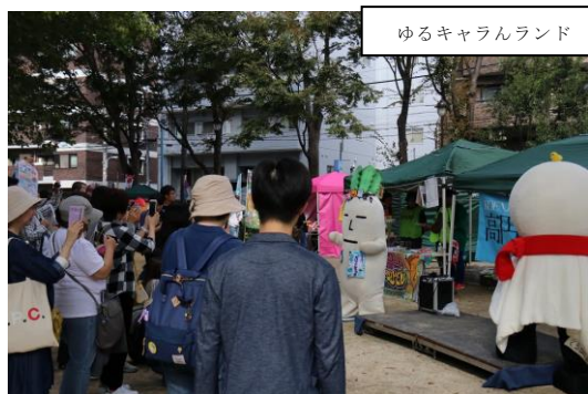
ゆるキャラランド

2日目となる明日も楽しみ切れないほどのイベントが盛りだくさんの高円寺フェス。ぜひご来場ください。