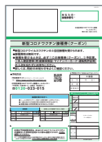
3回目接種では必須 ※職場で接種の場合も