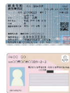
健康保険証・マイナンバーカード等