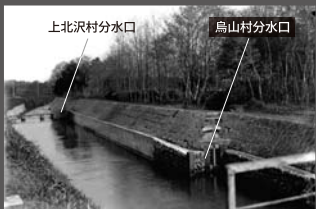
大正末期～昭和初期の分水口