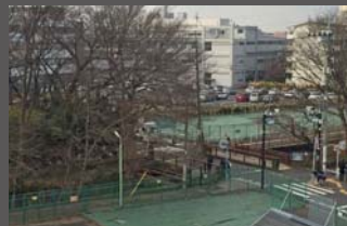
平成27（2015）年当時の岩崎橋