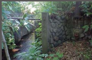
上北沢村分水口跡