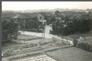
昭和18（1943）年当時の岩崎橋