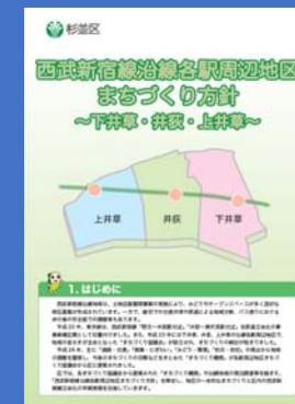
西武新宿線沿線各駅周辺地区 まちづくり方針 平成28年1月策定