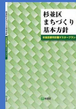
杉並区まちづくり基本方針 (杉並区都市計画マスタープラン) 平成25年8月改定