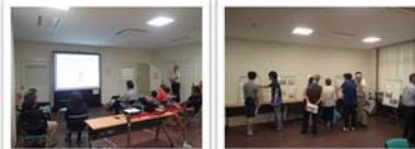
（オープンハウス当日の様子）