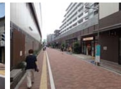
（事例写真）側道整備