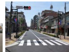
（事例写真）拡幅整備