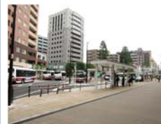
（事例写真）駅前広場