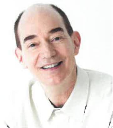
日本文学研究者・早稲田大学特命教授 ロバート キャンベルさん Robert Campbell

ニューヨーク市出身。専門は江戸・明治時代の文学、特に江戸中期から明治の漢文学、芸術、思想などに関する研究を行う。テレビでMCやニュース・コメンテーター等をつとめる一方、新聞雑誌連載、書評、ラジオ番組出演など、さまざまなメディアで活躍中。