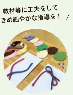
教材等に工夫をしてきめ細やかな指導を!

比較的軽度な知的発達の遅れがあり、通常の学級における指導では十分に効果を上げることが難しい児童・生徒に対して、教材等に工夫をしながら少人数での指導を行います。居住地により指定された特別支援学級に在籍し、毎日通って学習をします。