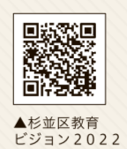
杉並区教育ビジョン2022

「杉並区教育ビジョン2022」が発信するメッセージを踏まえ、特別支援教育では、関わる全ての人が自分事として捉えていくことをめざします。