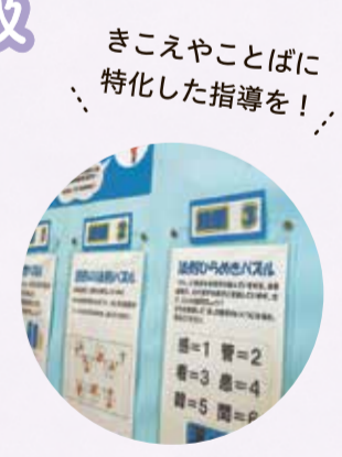
きこえやことばに特化した指導を!