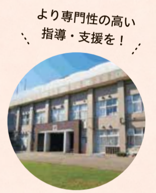
より専門性の高い指導・支援を!

都内で唯一の区立知的障害特別支援学校です。知的発達の遅れがあり言葉や文字による意思疎通が難しいなど、日常生活を送る上で頻りに援助を必要とする児童・生徒に対して、一人ひとりの障害の程度や状態に応じた、より専門性の高い指導・支援を行います。