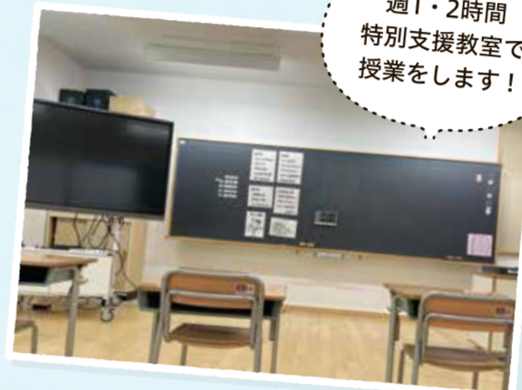
週1・2時間特別支援教室で授業をします!