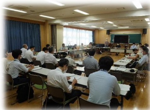
▲第1回懇談会の様子 (8/9)