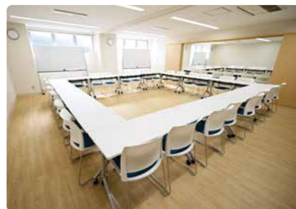
第1・2集会室(一体使用)

●町会・自治会の活動や、文化や趣味等のグループ活動に利用することができるほか、講座や多世代交流イベントへの参加を通じて、身近な地域における世代を超えた交流や、コミュニティづくりができる貸室です。 ●集会室の一部の時間帯に高齢者団体優先枠を設け、一般利用者等とのタイムシェアをしていきます。