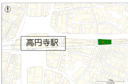
<高円寺東高架下自転車駐車場>