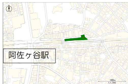
<阿佐ヶ谷東自転車駐車場>