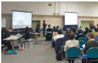
▲過去のシンポジウムの様子

活動内容の報告と障害当事者の委員によるパネルディスカッションを通して、地域で自分らしく生活する様子や、コミュニケーションなどについてお話しします。