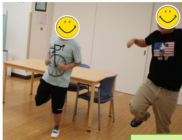
体操・ウォーキング